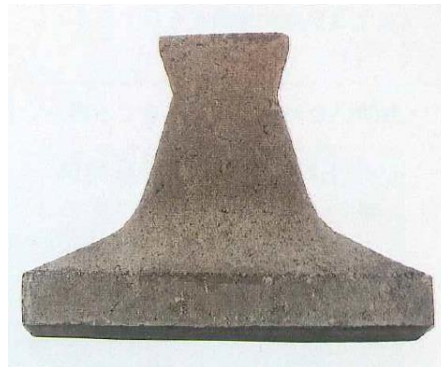
ブロキASTER F 0.2%添加